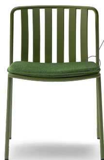
3640.3 EN: Optional cushion for items 3640 and 3645 IT: Cuscino opzionale per gli articoli 3640 e 3645