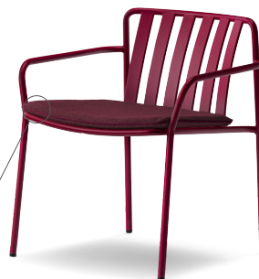
3649.3 EN: Optional cushion for item 3649 IT: Cuscino opzionale per articolo 3649

EN: Cushion padded with expanded polyurethane foam, covered in water-repellent fabric. A magnet inside the padding allows it to be fixed to the seat. IT: Cuscino imbottito con schiuma di poliuretano espanso rivestito in tessuto idrorepellente. Un magnete all'interno dell'imbottitura permette il fissaggio alla seduta. DE: Kissen mit Polsterung aus expandiertem Polyurethanschaum, bezogen mit wasserfestem Stoff. Ein Magnet im Inneren der Polsterung ermöglicht die Befestigung am Sitz. FR: Coussin rembourré de mousse de polyuréthane expansée, revêtu d'un tissu déperlant. Un aimant à l'intérieur du rembourrage permet la fixation à l'assise. ES: Cojín acolchado con espuma de poliuretano expandido, revestido con tejido hidrorrepelente. Un imán dentro del acolchado permite su fijación al asiento.